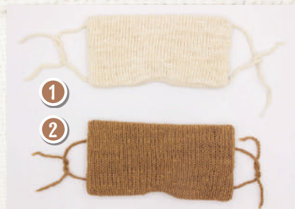
マリムーンアイマスク