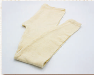
ふらズボン下 (S・M・L)

布良の糸を編み、細いゴムでやさしくフィット感をサポート。心地よい肌触り。ぜひ肌に直にご愛用ください。