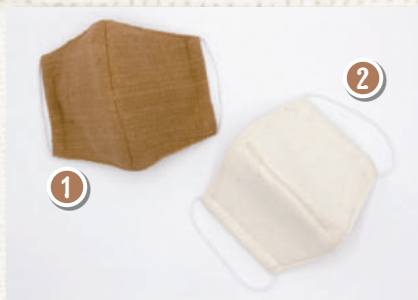
マリムーン立体マスク