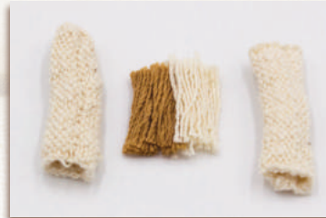
マウスクリーン・指サック