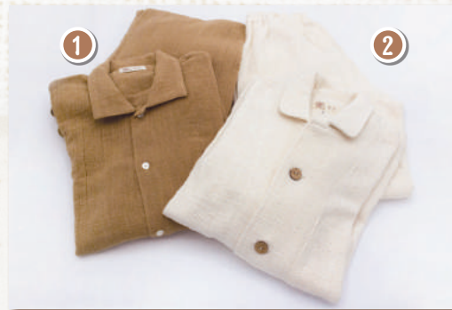
① 茶綿パジャマ ② 生成パジャマ (S・M・L・LL)

布良に包まれて眠る幸せを味わってください。布良創業時からのロングセラー。部屋着としても人気です。