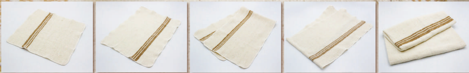
ふらそらクロス 1 約 25x25 cm

ハンカチサイズの正方形のクロス。三つ折りにしてナプキン替わりに愛用する人も。眼鏡拭きにもおすすめ。