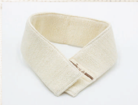
マリムーンフリー (約 5x48cm)