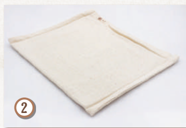
マリムーンスクエア (約 30x35cm)