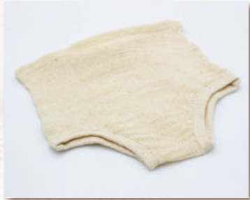
ふらショーツ (S・M・L)

やわらかい子供の肌をそっと包みこみます。 *タンクトップ・半袖の2タイプあります。