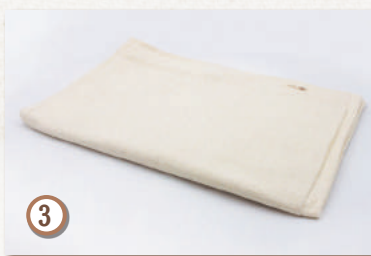
マリムーンクウォーター (約 50x100cm)