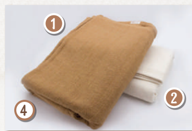
マリムーンロング (100x200cm)