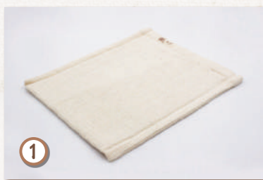
マリムーンミニ (約 23x30cm)