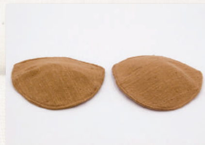
マリムーンブラパット (M・L)