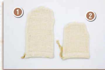
ふらそらエステミトン