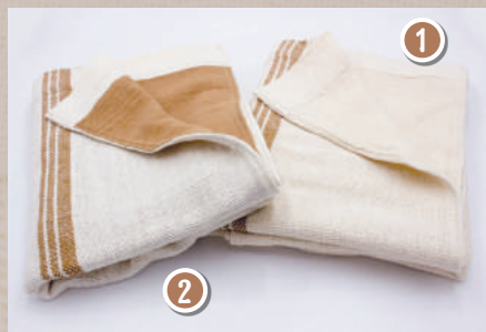
① 生成ガーゼ (裏地) ② 茶ガーゼ (裏地)