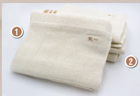
① ふらそらシート 120x240 cm

大判サイズ。タオルとして使うほか、赤ちゃんのおくるみなどにも。肩掛けや膝掛けにも活躍します。