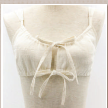
ふらブラジャー (S・M・L)

体の内側から温かくなります。生理痛緩和やかぶれなど、さまざまなストレスをサポートしてくれます。