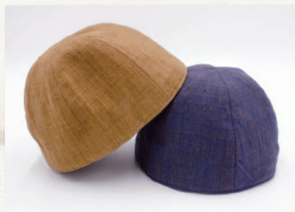
マリムーン帽子 (S・M・L)